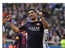
La marca que confirma que Luis Suárez es un 'killer' del área