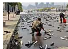
La lluvia de peces existe. ¡Si no te lo crees mira! (El Tiempo)