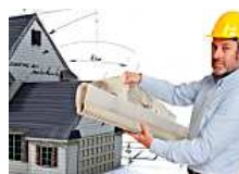
Reformas integrales completas de casas por Reformadísimo con un resultado muy especial. (Reformas Integrales Madrid)