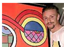
Guti incendia las redes a costa del Depor - Barça