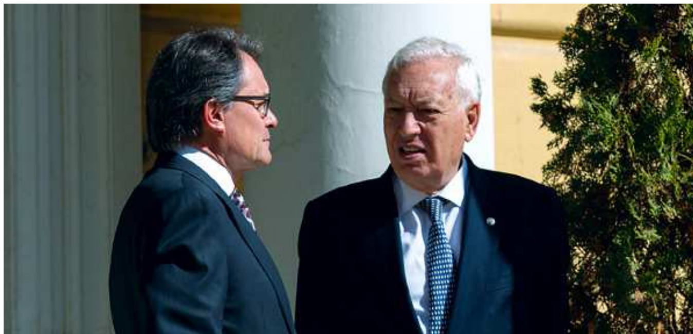
Artur Mas y José Manuel García-Margallo

El Ateneo de Madrid prepara un debate entre el exministro de Exteriores y el expresidente de la Generalitat.