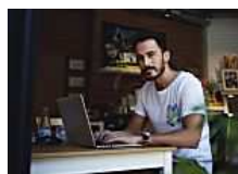
¿Cómo aumentar la velocidad de su PC? (OneSafe Software)