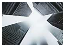
El IPC del mes de febrero en España se ha situado por segundo mes consecutivo en el 3% interanual (BBVA)