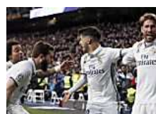
Polémica por los tuits de LaLiga elogiando con descaro a Ramos